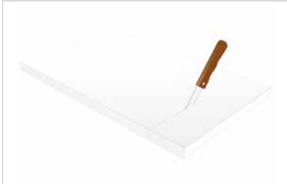
Absorber auf erforderliche Größe zuschneiden