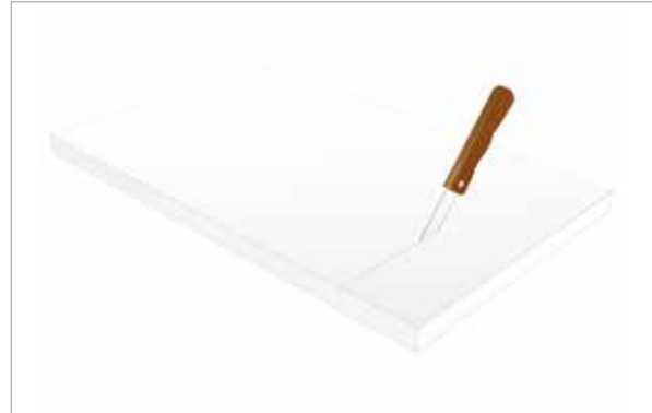
Absorber auf erforderliche Größe zuschneiden

Bei trockener, frostfreier Lagerung mindestens 12 Monate bei ungeöffneter Originalverpackung.