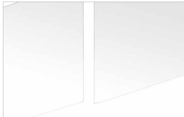
Absorber mit einer Fuge von min. 20 mm verkleben